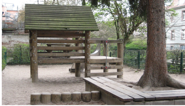
Blick auf einen Teil des Hofes

Wir würden uns freuen, wenn Sie unseren Katholischen Kindergarten Edith-Stein näher kennen lernen möchten.