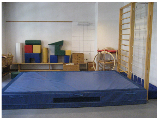
Blick in den Turnraum